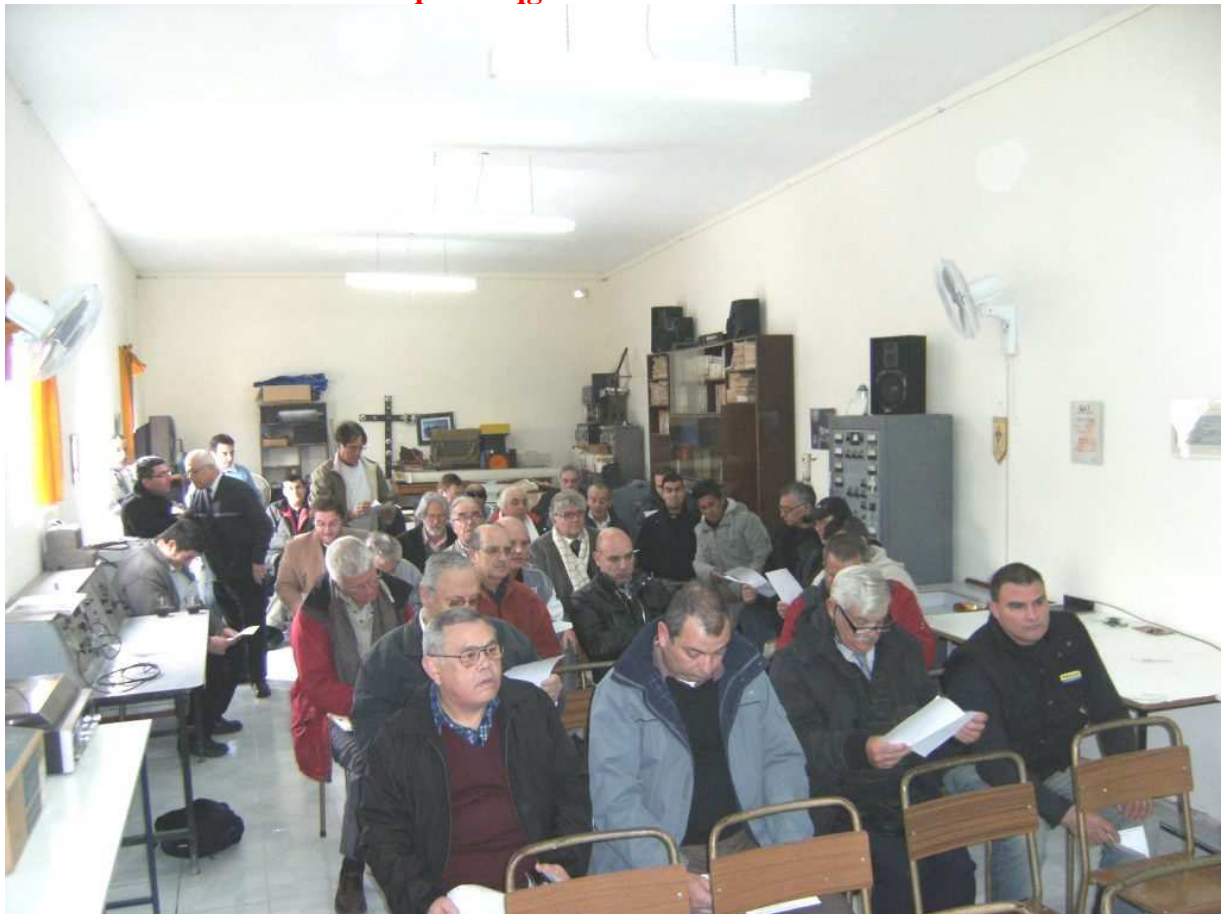
Membri waqt il-Laqgħa Ġenerali Annwali 27.02.2011