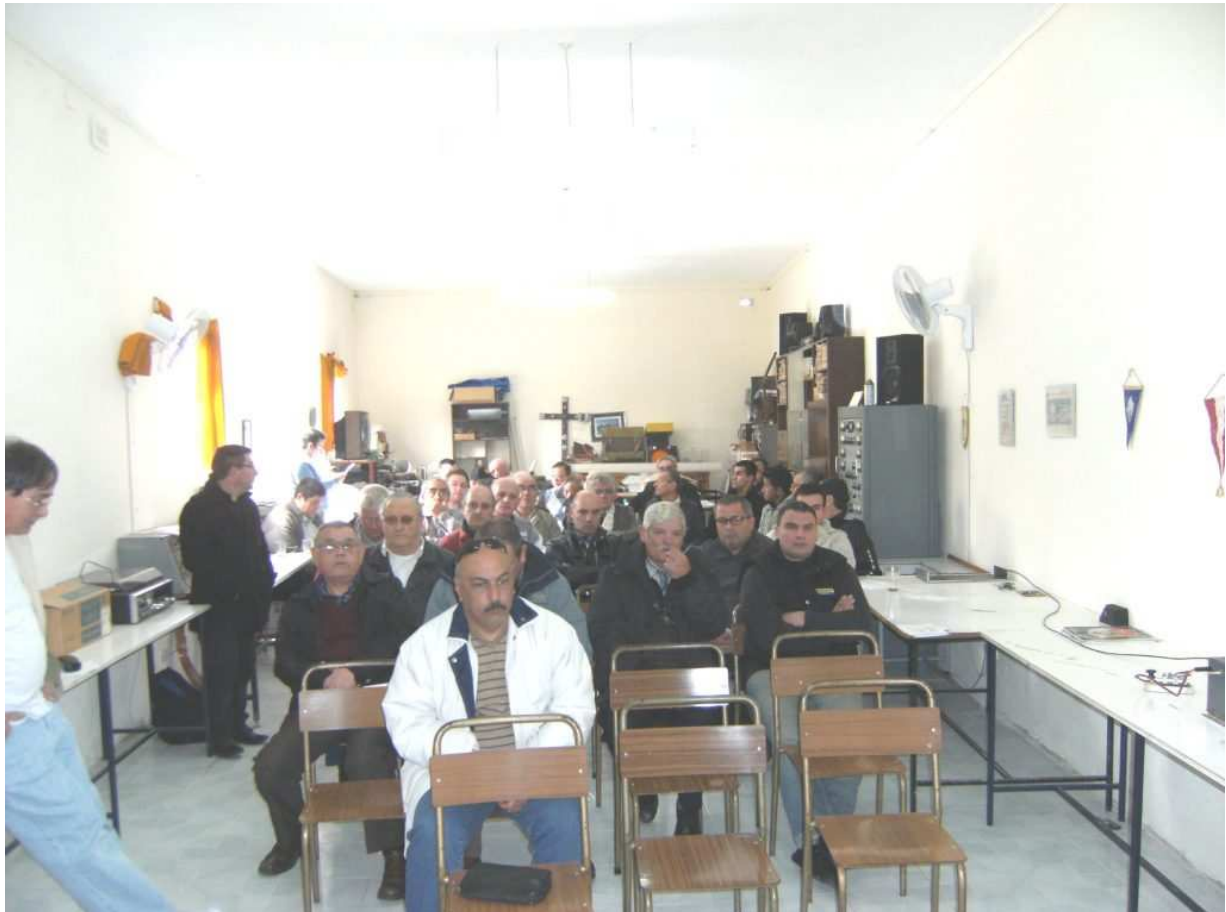
Membri waqt il-Laqgħa Ġenerali Annwali 27.02.2011