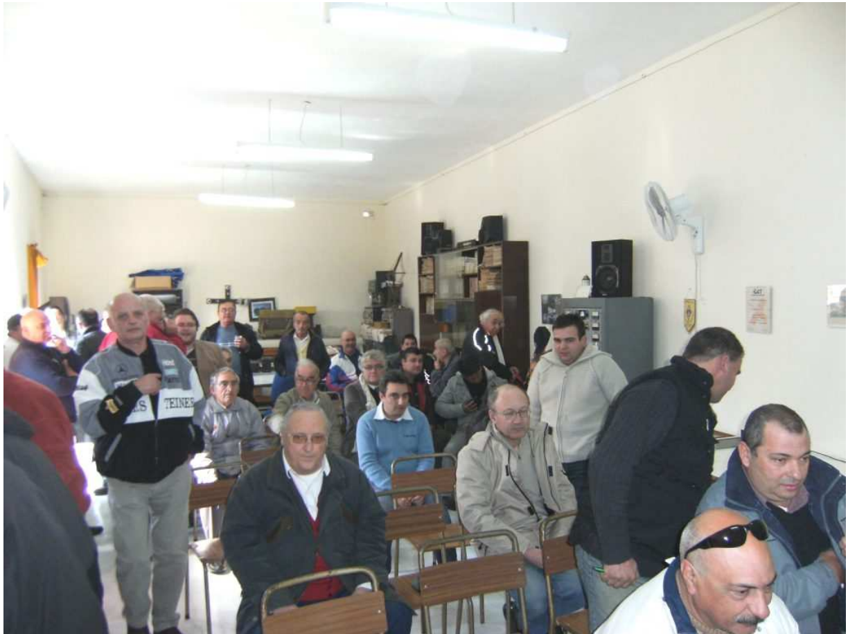
Membri waqt il-Laqgħa Ġenerali Annwali 27.02.2011